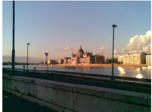
BUDAPEST, MAI 2013

Le 23 mai 2013 a eu lieu à l'Université ELTE au centre de Budapest un colloque entièrement consacré à certaines des facettes les plus importantes de la pensée de Denis de Rougemont. Le colloque a pu avoir lieu grâce au soutien de l'Institut français de Budapest et de l'Ambassade de Suisse en Hongrie. Il a coïncidé avec le lancement d'un groupe de la francophonie à Budapest.