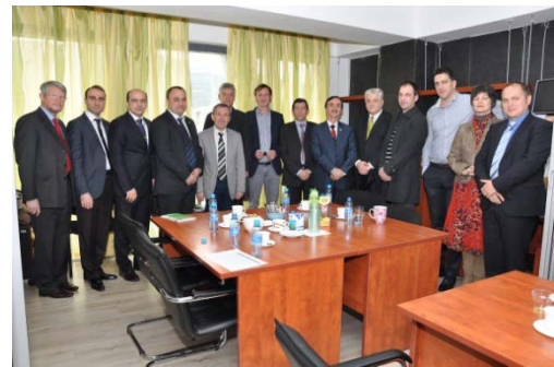
NALAS VIII, SKOPJE, 19.04.2013